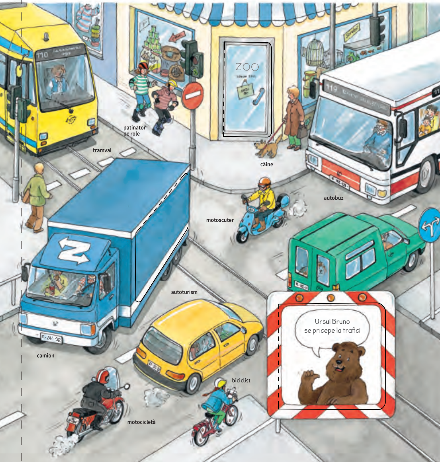
patinator pe role